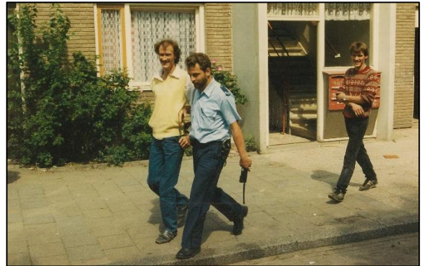
tot die stoute mijnheer het van me afpakte.