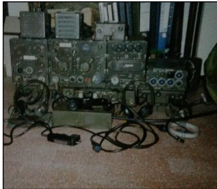
en dit was mijn speeltje waar ik uren mee zoet was