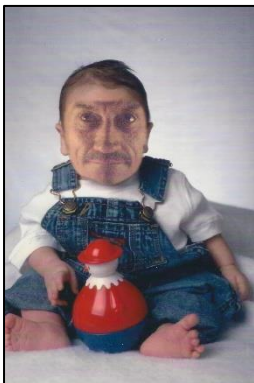
Dit ben ik als lieve kleine jongen